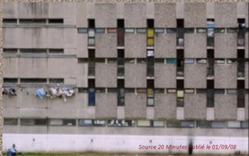
publié le 01/09/08