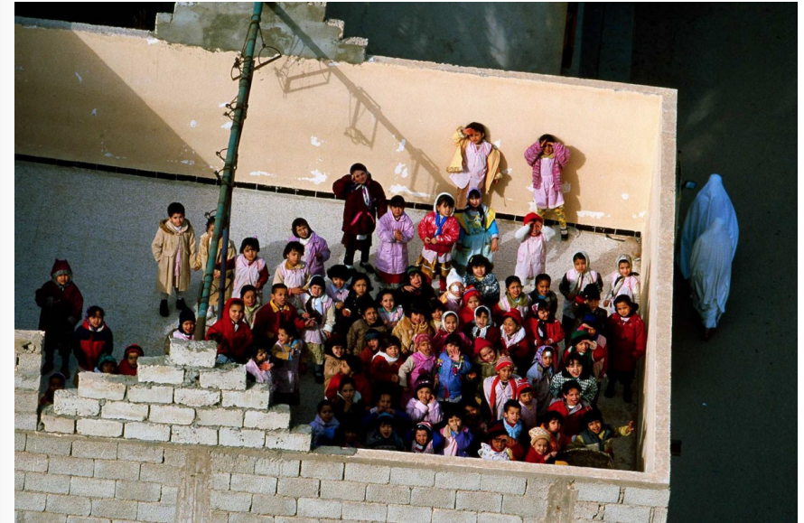
École à Ghardaïa, Algérie (32° 31' N - 3° 37' E). ↑

« Que diront nos enfants dans vingt ans ? Que l'on n'a rien fait ? Ou bien que l'on a été extrêmement courageux ? Cela implique un changement de civilisation, et j'ai bien conscience que c'est très complexe. »