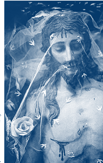
Alcantara (Brésil), église do Camo.

Sur une colline ils ont crucifié trois hommes, dont un qui avait essaimé des paroles prophétiques.